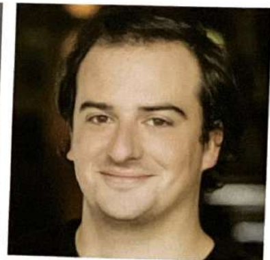
Louis Carrière comédien