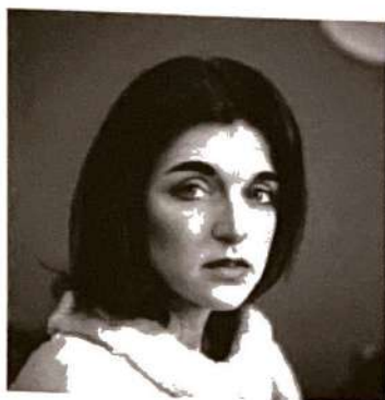
Vera Stadler comédienne