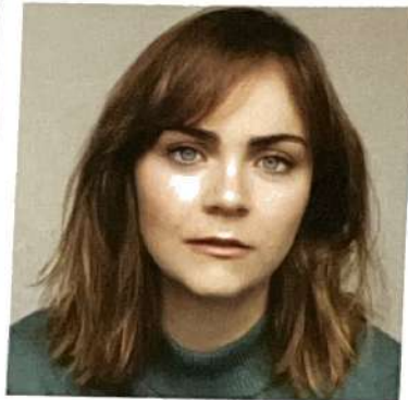
Roxanne Azzaria comédienne