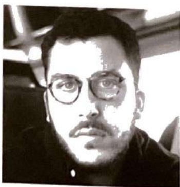
Rayan Ouertani comédien